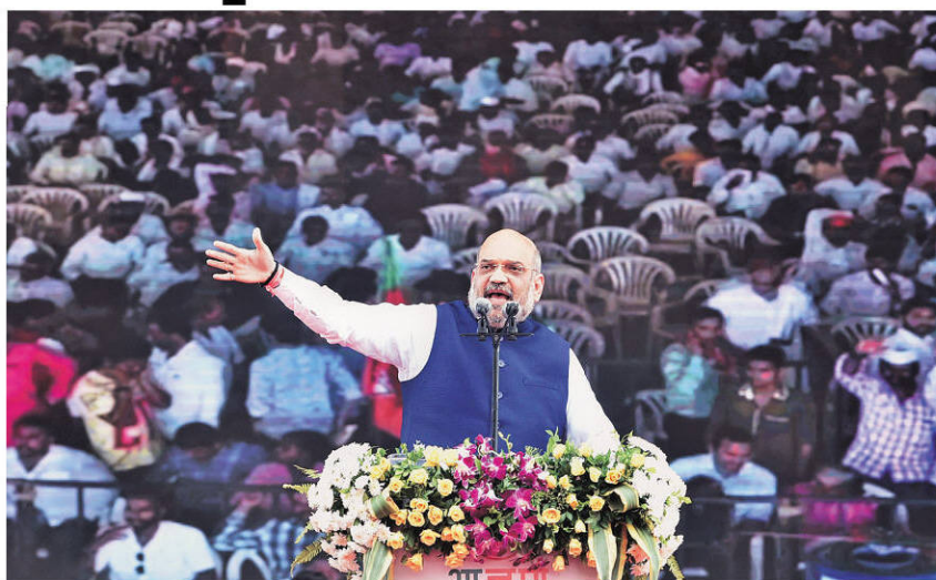
BJP chief Amit Shah at the party's 38th Foundation Day celebrations in Mumbai on Friday

In New Delhi, the PM addressed a BJP parliamentary party meeting, and later interacted with BJP district presidents and