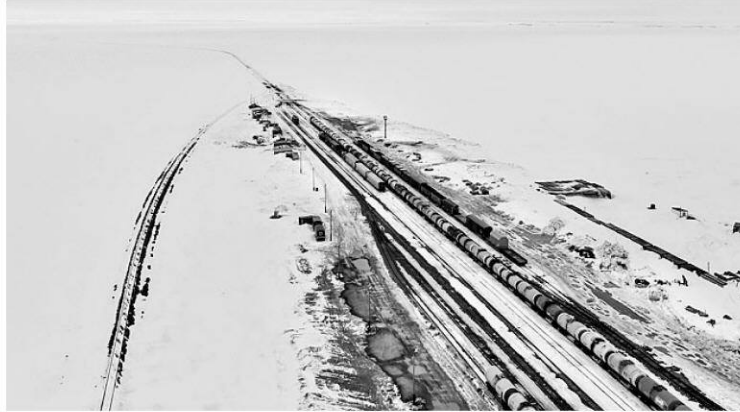
A railway station constructed to supply gas fields in the Arctic Yamal peninsula

Yet the attempt to rally US allies faces an uphill battle as the Arctic emerges as a potential 21st century geopolitical flashpoint in the way transportation routes like the Suez Canal were in the 20th. Perry was followed on stage by Dmitry Artyukhov, the governor of the Yamal-Nenets region in Russia. He spelled out the growing international involvement in